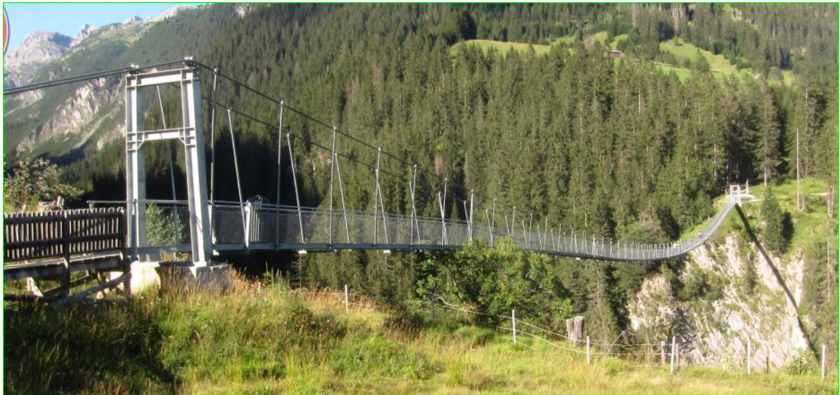
Hängebrücke über das Höhenbachtal